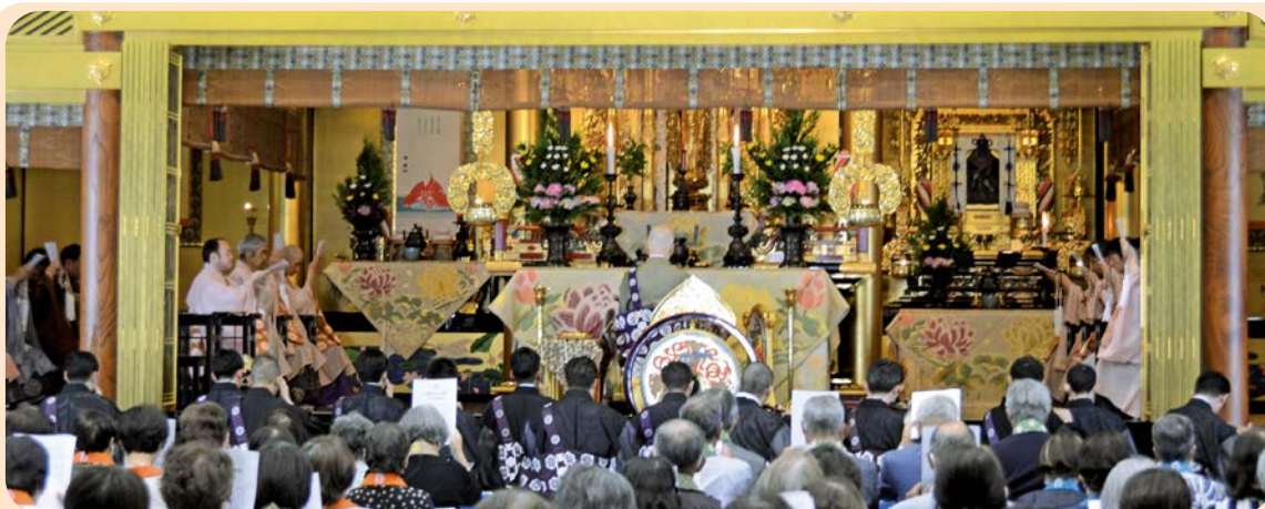
本願寺山口別院 永代経法要の様子