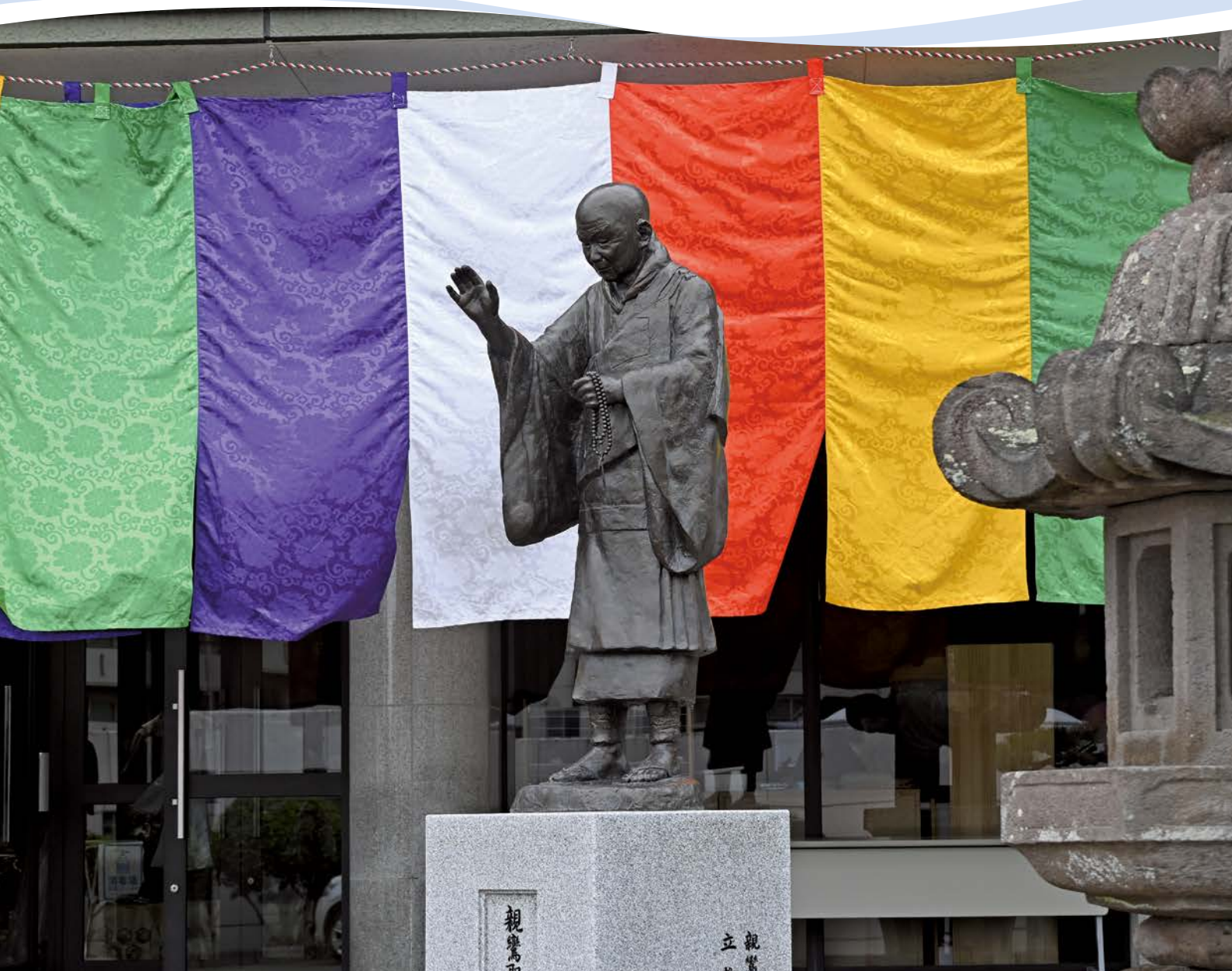
本願寺山口別院 親鸞聖人尊像 白鳥文明作