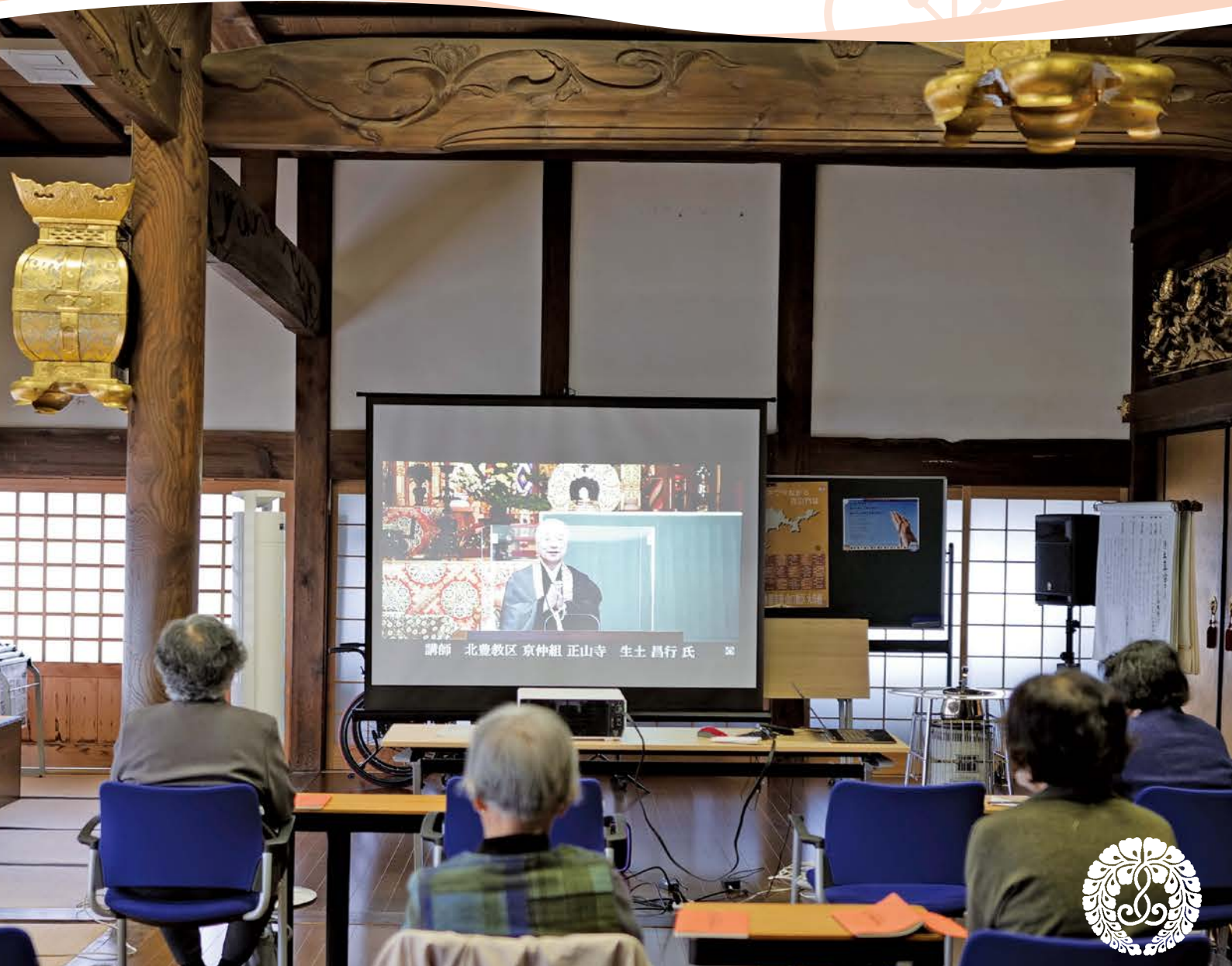
山口別院報恩講 寺院でのWEB中継(大島組妙善寺)

新型コロナウイルスの感染拡大が続いております。 各寺院におかれましても、予防対策の徹底をお願いいたします。