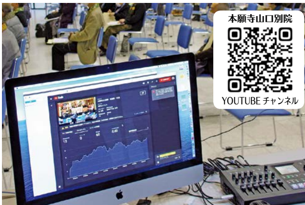
YOUTUBE での LIVE 配信の様子

当日お参りがかなわなかった方や、まだご覧になっておられない方は是非視聴してみてください。広報部員と職員が手探りで配信をしております。プロのような配信とはまいりませんが、今後も可能な限り法座や研修会を配信していく予定です。配信に関するさまざまなご意見・ご感想、また広報部の活動を手伝ってみたいなどございましたら、教務所までお寄せください