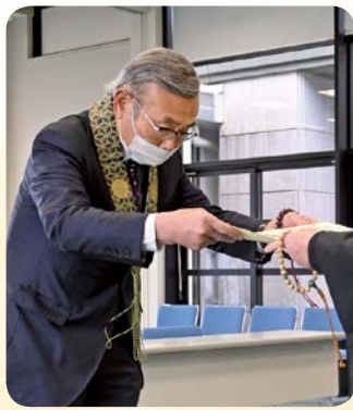
当選状交付の様子

この度の選挙は当選人のみの立候補で無投票となりましたため、選挙日の12月11日(僧侶)と12月14日(門徒)に当選状を交付いたしました。